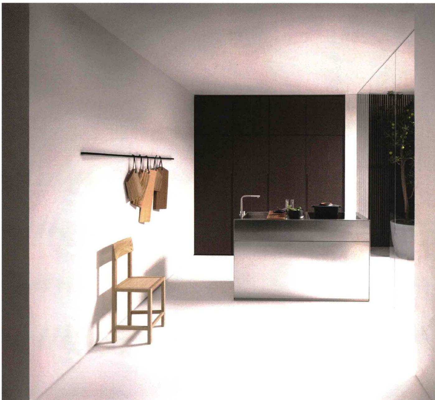
Falper, Small Living Kitchen